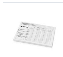
Bloc para audio- gramas

Los componentes y accesorios varían según la región y la configuración.