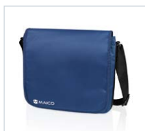
Estuche de trans- porte