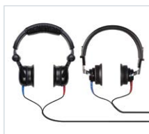
Audífonos de CA DD45