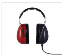
Audífonos de CA DD65 v2