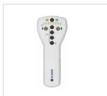
Appareil portatif MA 1