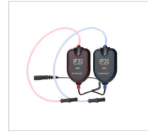
Auriculares de inserción IP30