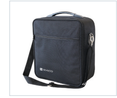
Estuche de transporte