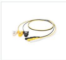
Cables conductores de los electrodos