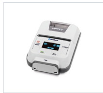
Impresora de etiquetas HM-E200