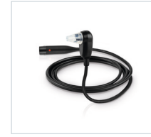
Sonda EOA SnapPROBE™