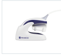
BERAphone® con base