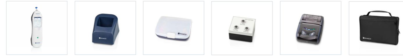
easyTymp Basisstation Ohrstöpsel-Box mit Ohrstöpseln Test-Cavity Drucker Tragetasche